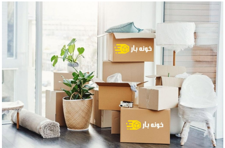
اتوبار آبادان منتظر تماس شماست

البته اگر بسته بندی اثاثیه منزل در آبادان را به باربری ما بسپارید، تمام این کارها بدون زحمت و البته با دقتی بسیار زیاد و کیفیتی مثال زدنی، برای شما انجام خواهد شد و شما می توانید آنها را در مقصد سالم و بی نقص و در بهترین شرایط تحویل بگیرید.