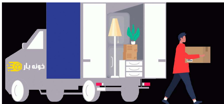
حمل بار آبادان در خدمت شماست

برای داشتن یک اسباب کشی خوب نیاز نیست که حتما خودتان و خانواده دست به کار شوید و از دیگر کارهای روزمره عقب بیفتید و در نهایت با بدنی رنجور و آسیب دیده وارد محل جدید شوید. کار را به کاردان بسپارید تا به بهترین شکل و کمترین خسارت، اسباب کشی داشته باشید. اهالی محترم شهرستان آبادان، می توانند حمل و اسباب کشی را به شرکت باربری آبادان ما محول کنند. پیچ اینستارگرام ما را دنبال کنید