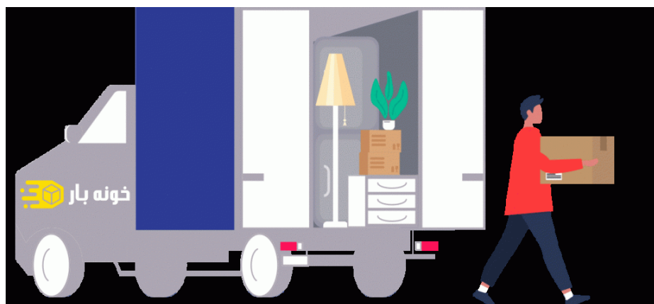
حمل بار آبادان در خدمت شماست

برای داشتن یک اسباب کشی خوب نیاز نیست که حتما خودتان و خانواده دست به کار شوید و از دیگر کارهای روزمره عقب بیفتید و در نهایت با بدنی رنجور و آسیب دیده وارد محل جدید شوید. کار را به کاردان بسپارید تا به بهترین شکل و کمترین خسارت، اسباب کشی داشته باشید. اهالی محترم شهرستان آبادان، می توانند حمل و اسباب کشی را به شرکت باربری آبادان ما محول کنند. پیچ اینستارگرام ما را دنبال کنید